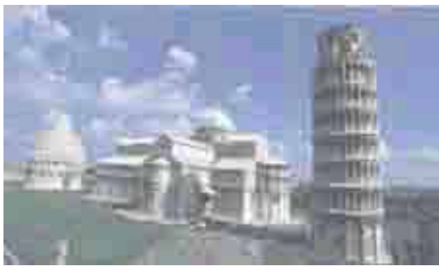
Torre, Catedral y Baptisterio en Pisa -Italia-

«El movimiento enciclopedista, al ocurrir la Revolución Francesa, se continuó por la escuela filosófica de los «ideólogos o ideologistas», iniciada por Condorcet, Sieyès, Roederer, Lakanal, Volney, Dupuis, Marechal, Naigeón, Saint, Lambert, Garat, Laplace, Pinel, etc.. En ellos aparecen influencias especiales de D'Alembert, Voltaire, Turgot, Helvecio, Rousseau, Holbacch, Diderot, y más directamente las de Smith, Hobbes, Locke y Kant; pero, en el dominio propiamente filosófico y psicológico, los más siguieron las huellas de Condillac, cuyo «Tratado de las Sensaciones» (1754) había sido un ensayo sistemático para derivar de la experiencia todas las funciones del intelecto humano. La doctrina sensacionalista de Condillac adquirió mayor importancia en los grandes representantes de la escuela: Cabanis y Destutt de Tracy. El primero le dió amplia base fisiológica y natural; el segundo la desarrolló en el dominio de las llamadas ciencias morales. Los nombres más ilustres del pensamiento francés, entre 1789 y 1810, están directamente vinculados a la escuela ideologista».